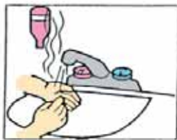
1. 使用溫水濕潤雙手。