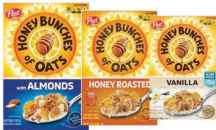
Honey Bunches de avena con almendras, miel tostada, Bunches de vainilla