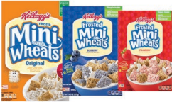
★ Frosted Mini Wheats Original, Fresa, arándano