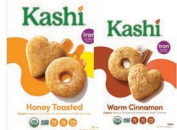
★ Kashi Miel tostada y Canela tibia