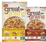
★ Great Grains Banana Nut Crunch y Crunchy Pecan