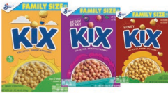
★ Kix, Kix Berry, Kix Honey