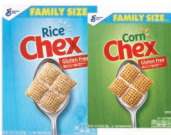
Chex de arroz, Chex de maíz