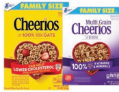
★ Cheerios, Cheerios multigrano