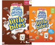
★ Frosted Mini Wheats Little Bites, Chocolate, Original