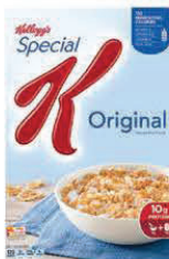
Special K Original