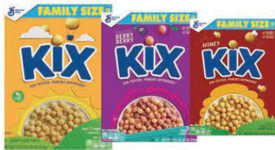
★ Kix, Kix Berry, Kix Honey