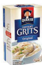
Sémola instantánea Quaker Tamaño original o familiar