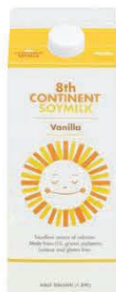
8th Continent Original o vainilla 1/2 galón