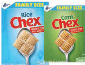
Chex de arroz, Chex de maíz