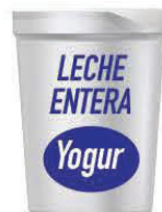
Yogur de leche entera

Para niños de 1 a 2 años de edad, SOLO se permite yogur de leche entera o cuarto de leche entera.