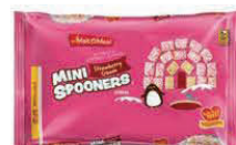
★ Crema de fresa Mini Spooners