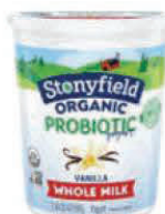
Leche entera orgánica Stonyfield

CUALQUIER Marca Natural o vainilla Un Envase de 32 oz. Griego y orgánico no permitido.