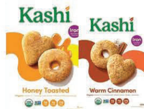
★ Kashi Miel tostada y Canela tibia