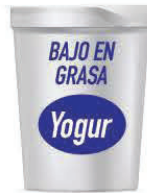
Envase de 32 oz.

Para mujeres y niños de 2 a 5 años, yogur bajo en grasa o sin grasa. CUALQUIER MARCA, CUALQUIER SABOR, INCLUIDO EL YOGUR GRIEGO