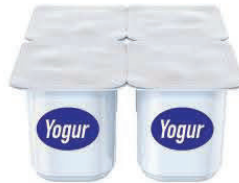
4 envases de 4 onzas (16 oz.)