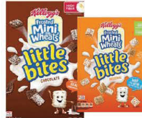
★ Frosted Mini Wheats Little Bites, Chocolate, Original