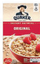
★ Avena Instantánea Quaker Original