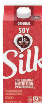
Silk Original 1/2 galón (NINGÚN OTRO SABOR APROBADO POR WIC)