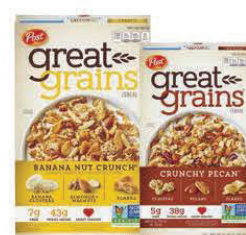
★ Great Grains Banana Nut Crunch y Crunchy Pecan