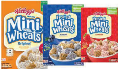
★ Frosted Mini Wheats Original, Fresa, arándano