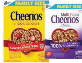
★ Cheerios, Cheerios multigrano