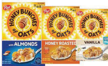
Honey Bunches de avena con almendras, miel tostada, Bunches de vainilla