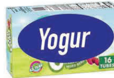
8 envases de 2 onzas (16 oz.) o 16 envases de 2 onzas (32 onzas)

Puede comprar paquete de 12 de 4 oz. (48 oz.), paquete de 16 de 4 oz. (64 oz.), o paquete de 24 de 2 oz. (48 oz.) si el saldo de beneficios lo permite.