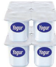
8 envases de 4 onzas (32 oz.)